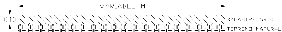
DETALLE DE SECCIÓN

CALLE HORTENSIA MORENO ANCHO = 7.00 MTS. (PROMEDIO) LONGITUD= 290.00 MTS. ÁREA TOTAL= 2,030.00 M2