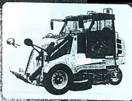
Modelo P — Hidráulico