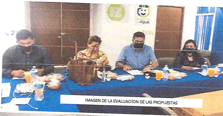
IMAGEN DE LA EVALUACIÓN DE LAS PROPUESTAS