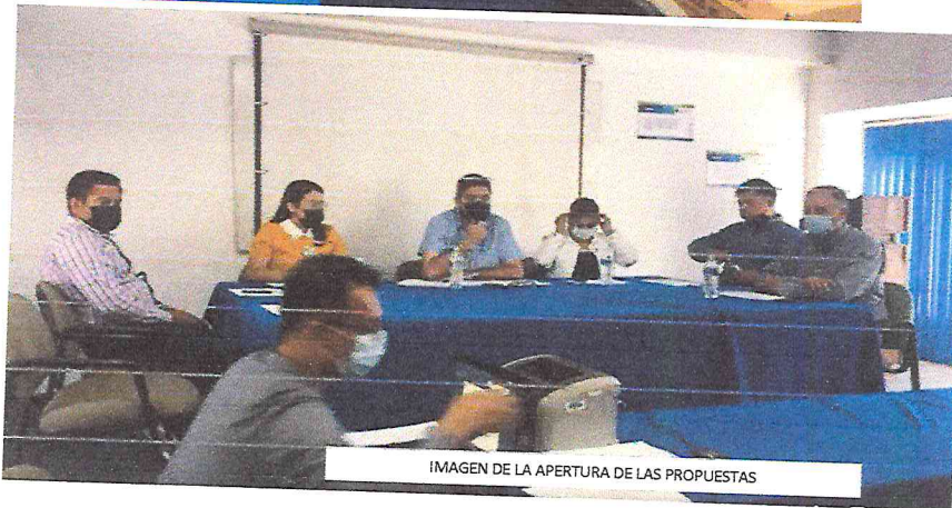
IMAGEN DE LA APERTURA DE LAS PROPUESTAS