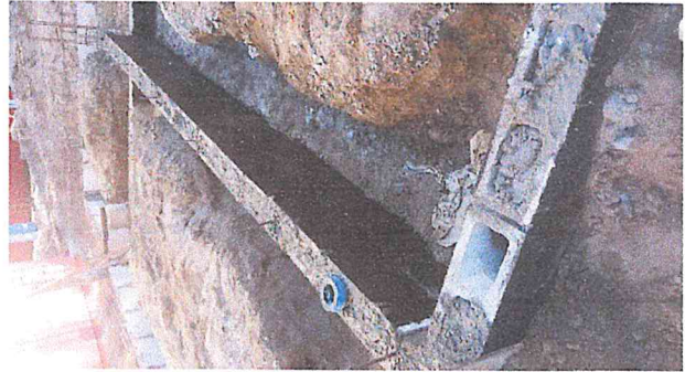
IMPERMEABILIZACION DE DALA DE DESPLANTE C/EMULTEX-ASB EN 3 CAPAS