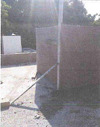
ELABORACION DE BASE PARA TINACO DE SECCION 1.50 X 1.50 INCLUYE: MURO,

OBRA: 6, CONSTRUCCION DE MODULO SANITARIO EN ESCUELA PRIMARIA EMILIANO ZAPATA EN LA COL. TIERRA Y LIBERTAD EN LA CIUDAD DE GUASAVE, MUNICIPIO DE GUASAVE, ESTADO DE SINALOA.