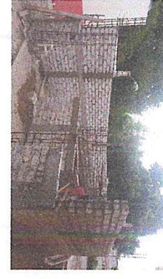
DALA DE INTERMEDIA SECCION 15X15 CMS., CON CONCRETO F'C=150 KG/CM2.

OBRA: 6, CONSTRUCCION DE MODULO SANITARIO EN ESCUELA PRIMARIA EMILIANO ZAPATA EN LA COL. TIERRA Y LIBERTAD EN LA CIUDAD DE GUASAVE, MUNICIPIO DE GUASAVE, ESTADO DE SINALOA.