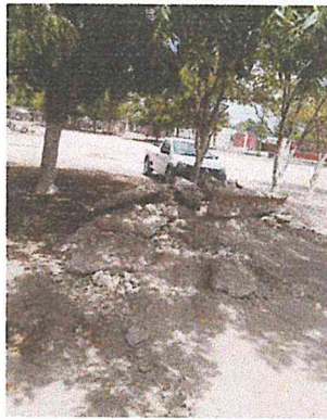
LIMPIEZA, TRAZO Y NIVELACION DEL TERRENO. INCLUYE: CORTE DE HAST 5 CMS