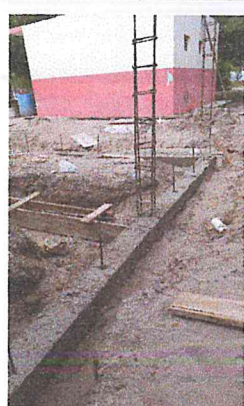
ZAPATA CORRIDA DE 70CM. DE ANCHO Y 15CM DE ESPESOR ARMADO CON VRS.