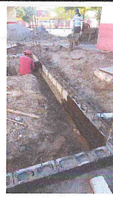
MURO DE BLOCK HUECO 15X20X40 CMS. JUNTEADO CON MORTERO

OBRA: 6, CONSTRUCCION DE MODULO SANITARIO EN ESCUELA PRIMARIA EMILIANO ZAPATA EN LA COL. TIERRA Y LIBERTAD EN LA CIUDAD DE GUASAVE, MUNICIPIO DE GUASAVE, ESTADO DE SINALOA.