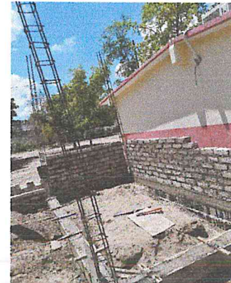
MURO DE TABIQUE DE JAL ARENA 10X14X28 CMS. ASENTADO CON MEZCLA