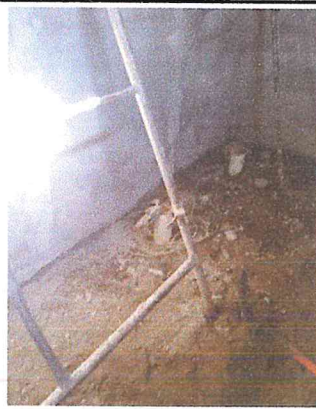
RELLENO COMPACTADO EN CAPAS NO MAYORES DE 20CM. CON MATERIAL