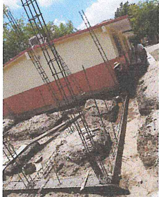
CADENA DE DESPLANTE CON CONCRETO F'C=250 KG/CM2 15x20 CM. ARM. C/4