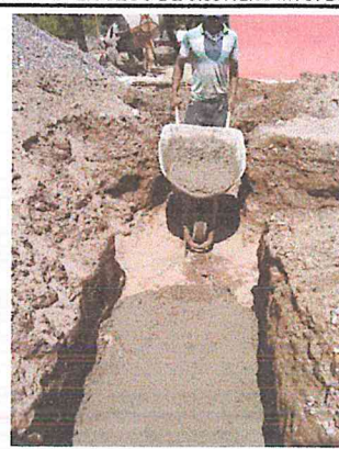
PLANTILLA DE CONCRETO F'C=100 KG/CM2 DE 5 CM. DE ESPESOR INCLUYE: