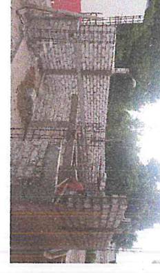
CASTILLO DE CONCRETO F'C=250 KG/CM2 15x20 CM. ARM. C/4 VAR. 3/8" Y