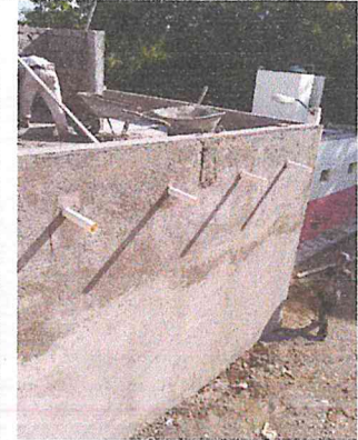
APLANADO CON MORTERO-ARENA EN PROPORCIÓN 1:4, ACABADO PULIDO CON