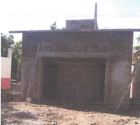
COLUMNA SECCION 20X25 CMS., CON CONCRETO F'C=250 KG/CM2, ARMADO CON