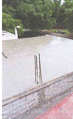
LOSA DE CONCRETO ARMADA DE 10 CMS. DE ESPESOR, ACABADO APARENTE,