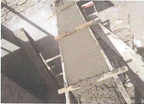
CADENA DE CERRAMIENTO DE 15X20 CMS. ARMADA CON 4 VRS. DE 3/8" Y EST. DE