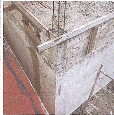
MURO DE ENRASE O PRETEL DE TABIQUE JAL ARENA 10X14X28 CMS. ASENTADO