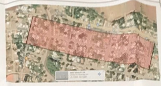
CROQUIS DE LOCALIZACION

NOTAS Y ESPECIFICACIONES EL PROYECTO DE DRENAJE SANITARIO Y OBRA CIVIL SERAN ELABORADOS BAJO LAS NORMAS DE LA DIRECCION GENERAL DE AGUA POTABLE Y ALCANTARILLADO DE LA C.N.A. Y LOS ALINEAMIENTOS DE LA JUNTA MUNICIPAL DE AGUA POTABLE Y ALCANTARILLADO. LAS LONGITUDES DE TUBERIA ESTAN APROXIMADAS EN METROS. EL APOYO DE LA TUBERIA REQUIERE PLANTILLA SELECTA. LA TUBERIA A UTILIZAR SERA DE PVC SANITARIO SERIE 20 DE PARED SOLIDA. LOS NIVELES DE ARRASTRE DE LA TUBERIA SE OBTENDRAN EN CAMPO Y SE DEBERAN AJUSTAR A LOS EXISTENTES.