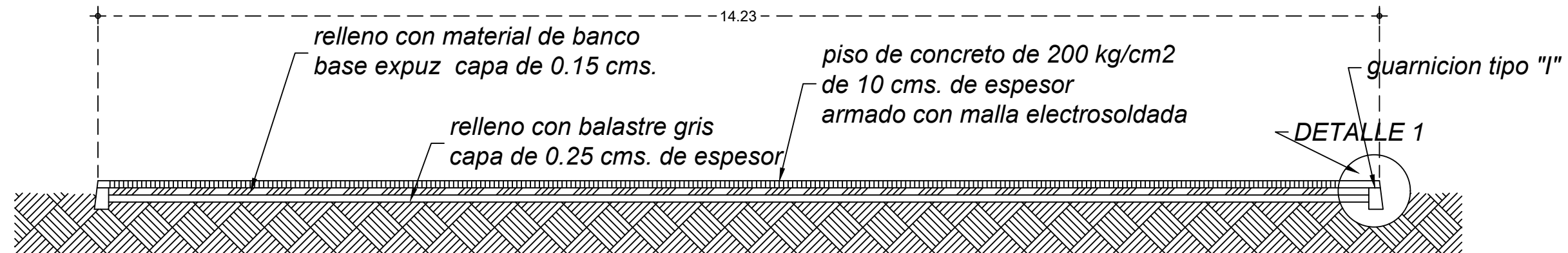
CORTE TRANSVERSAL DE CANCHA DE USOS MULTIPLES PROYECTO