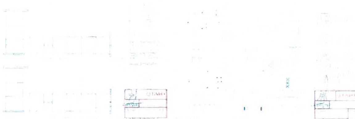
Plantas de Instalaciones Eléctricas