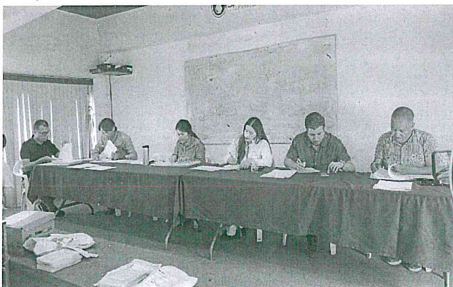
APERTURA DE PROPUESTAS