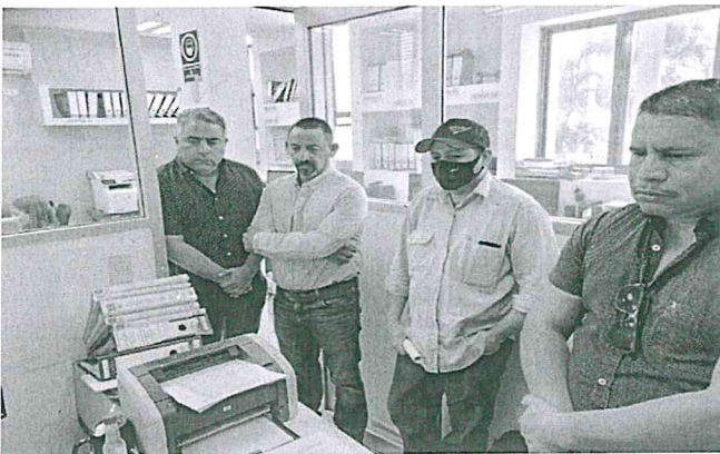
VISITA DE OBRA.

ACTO SEGUIDO, SE DIO LECTURA AL ACTA DE VISITA DE OBRA Y SE FIRMÓ POR LOS ASISTENTES.