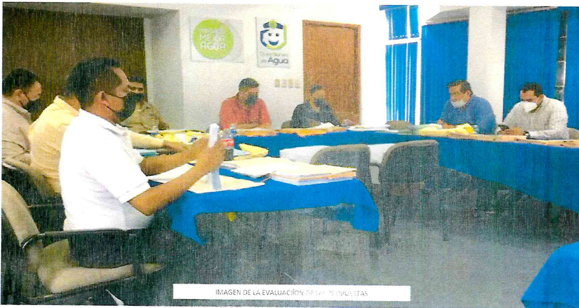
IMAGEN DE LA EVALUACIÓN DE LAS PROPUESTAS