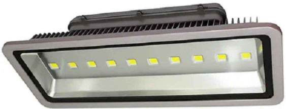
DETALLE DE LUMINARIA

Reflector LED 500w Halcón Plus 500 FR-HALCONPLUS500 Forlighting