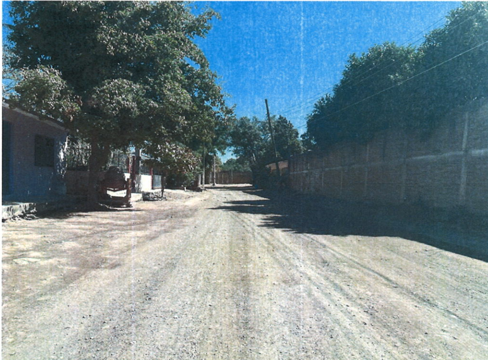
FOTOGRAFIA VISITA CALLE NIÑOS HEROES