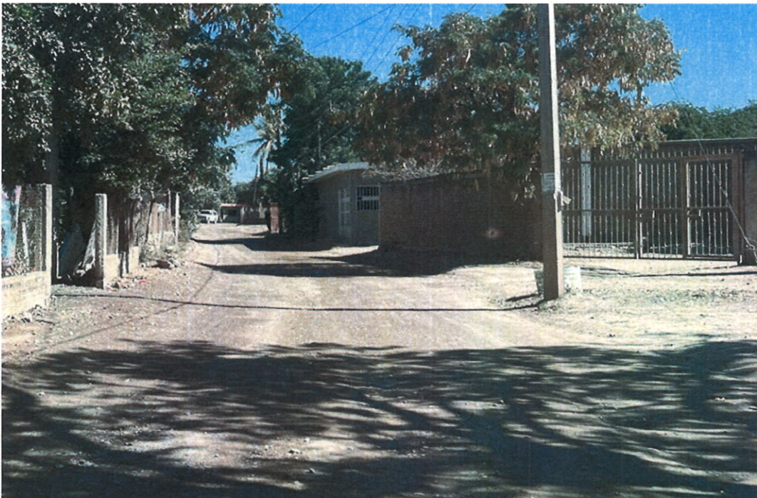
FOTOGRAFIA VISITA CALLE NIÑOS HEROES