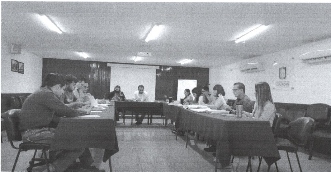
Ilustración 3 Recepción y Apertura de Propuestas.