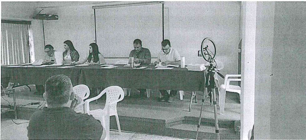
APERTURA DE PROPUESTAS.

SE ELABORA LA RELACIÓN DEL CONTENIDO DOCUMENTAL DE CADA UNA DE LAS PROPUESTAS PRESENTADAS, LA CUAL ES RUBRICADA POR QUIEN PRESIDE EL AVENTO A NOMBRE DE LA CONVOCANTE, ASÍ MISMO DE ENTRE LOS LICITANTES QUE ASISTIERON , SE ELIGE A UNO PARA QUE EN FORMA CONJUNTA CON EL SERVIDOR PÚBLICO DESIGNADO POR LA CONVOCANTE, RUBRICAN LAS PROPUESTAS TÉCNICAS Y ECONÓMICAS DE LOS LICITANTES, Y DE ACUERDO CON LO ESTABLECIDO CON LA LEY DE OBRAS PÚBLICAS Y SERVICIOS RELACIONADAS CON LOS MISMOS DEL ESTADO DE SINALOA, SE INFORMA QUE LA DOCUMENTACIÓN QUEDA BAJO RESGUARDO DEL COMITÉ DE OBRAS DEL MUNICIPIO DE AHOME, PARA QUE SEAN EVALUADAS EN FORMA CUALITATIVA POR EL MENCIONADO COMITÉ, EN JUNTA PÚBLICA QUE SE LLEVARÁ A CABO EN EL MISMO LUGAR, EL DÍA 9 DE MAYO DEL 2024 EN PUNTO DE LAS 10 HRSPM, INVITANDO LOS PRESENTES A QUE ACUDAN EN LA MISMA SALA EL DÍA LUNES 3 DE JUNIO A LAS 14 HRS PM, PARA LA CELEBRACIÓN DEL ACTO EN EL CUAL SE DARÁ A CONOCER EL RESULTADO DEL ANÁLISIS CUALITATIVO DE LA DOCUMENTACIÓN ADICIONAL Y DE LAS PROPUESTA TÉCNICAS Y ECONÓMICAS DE LOS PARTICIPANTES, Y DAR EL FALLO DE LA LICITACIÓN, PROCEDIENDO EL RECURSO DE INCONFORMIDAD DE ACUERDO ALA ARTÍCULO 111 DE LA LEY DE OBRAS PÚBLICAS Y SERVICIOS RELACIONADOS CON LAS MISMAS .