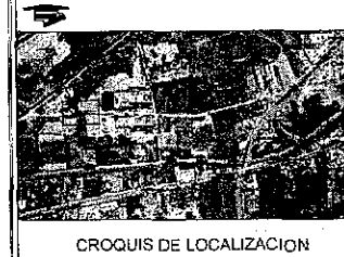
CROQUIS DE LOCALIZACION