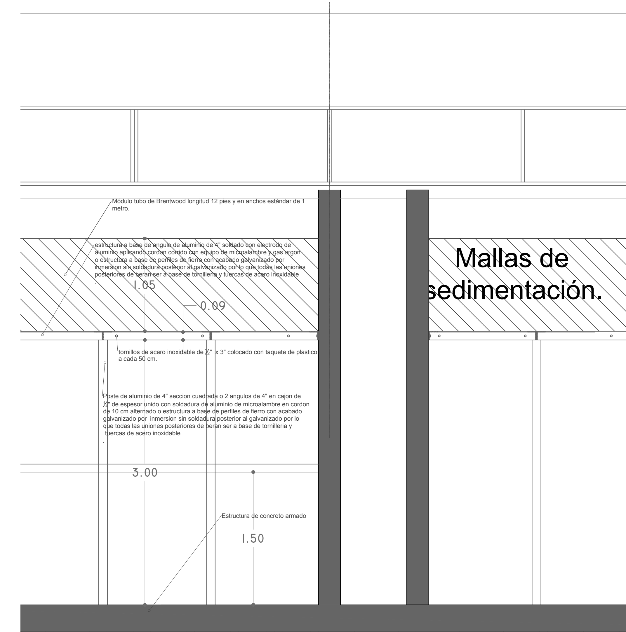
ESTRUCTURA DE SOPORTE MALLAS ESC 1:25