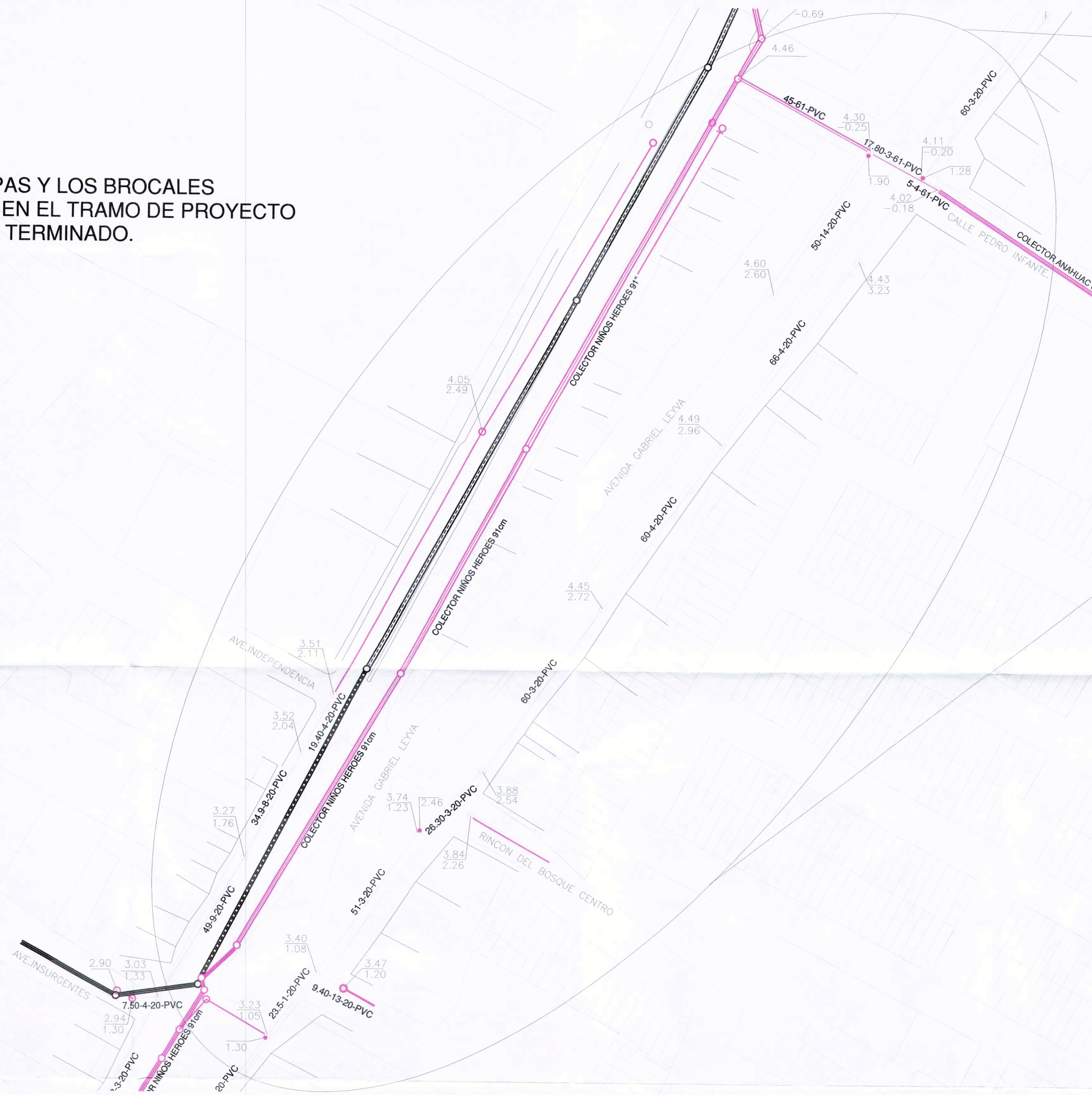
VISTA AEREA SECCIÓN 5 AVENIDA GABRIEL LEYVA