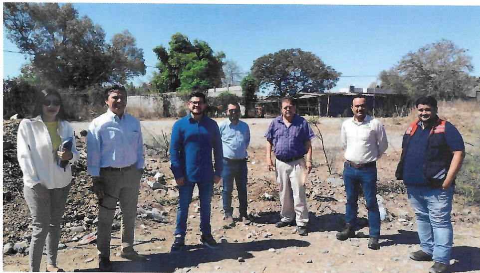
PARTICIPANTES DE LA VISITA DE OBRA