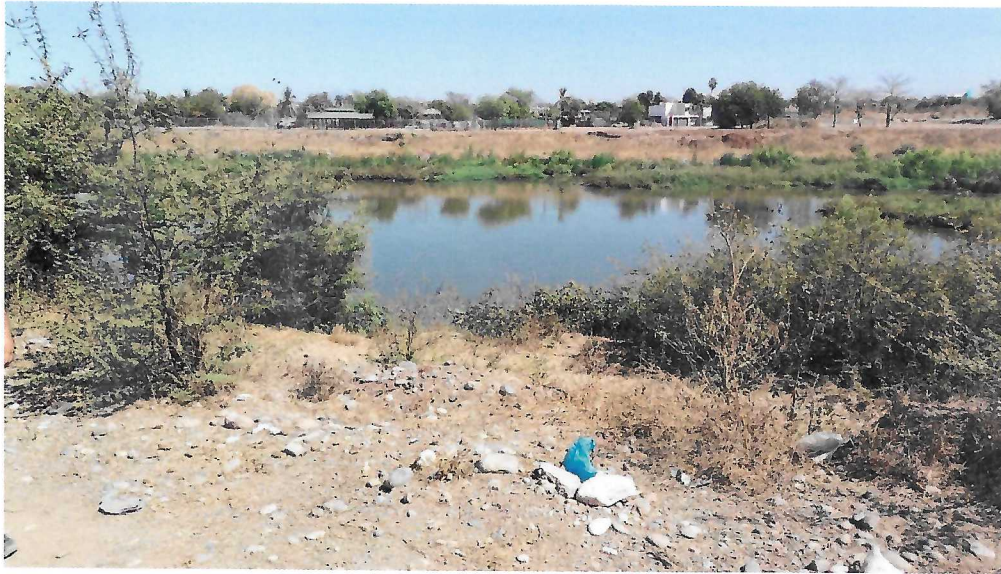
SITIO PROPUESTO PARA LA DESCARGA DE LAS AGUAS PLUVIALES