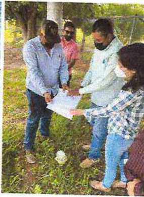
-Revisión del Proyecto