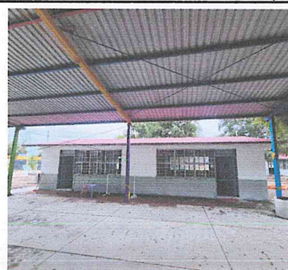
PINTURA VINILICA EN CALIDAD COMEX O SIMILAR LAVABLE, PARA MUROS,