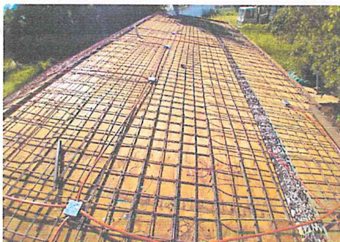
SALIDA PARA ABANICO DE TECHO INCLUYE BAJADA PARA CAJA DE CONTROL.