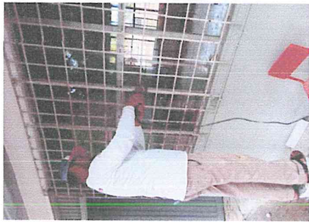
REPOSICION DE CRISTALES DAÑADOS Y MANTENIMIENTO A RIELES Y ALUMINIO

OBRA: 24.- REHABILITACION DE AULAS EN JARDIN DE NIÑOS JOSEFINA CHANG EN LA LOCALIDAD DE GABRIEL LEYVA SOLANO, MUNICIPIO DE GUASAVE, ESTADO DE SINALOA. NO. CONTRATO: N° FISMDF-R33/2022 AD-MGU003 PU LOCALIDAD: GABRIEL LEYVA SOLANO, GUASAVE, ESTADO DE SINALOA PERIODO DEL CONTRATO: 11/07/2022 AL PERIODO DE EJECUCION 11/07/2022 AL