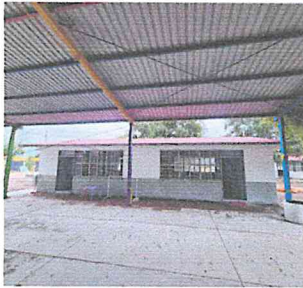
IMPERMEABILIZACION DE LOSA CON CARTON ARENADO (DIABLO ROJO PLUS FP)