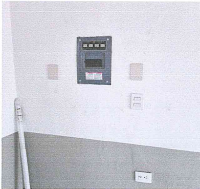
SUM. Y COL. DE INTERRUPTOR TERMOMAGNETICO DE 1 POLO 15 A 50 AMP. TIPO