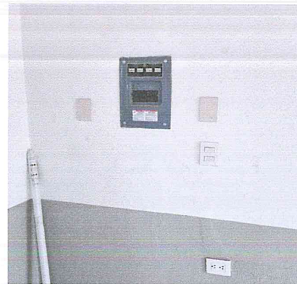
SALIDA DE APAGADOR O CONTACTO INCLUYE: MATERIALES Y LA MANO DE OBRA

OBRA: 24.- REHABILITACION DE AULAS EN JARDIN DE NIÑOS JOSEFINA CHANG EN MUNICIPIO DE GUASAVE, ESTADO DE SINALOA. NO. CONTRATO: N° FISMDF-R33/2022 AD-MGU003 PU LOCALIDAD: GABRIEL LEYVA SOLANO, GUASAVE, ESTADO DE SINALOA PERIODO DEL CONTRATO: 11/07/2022 AL 08/10/2022 PERIODO DE EJECUCION 11/07/2022 AL 06/12/2022