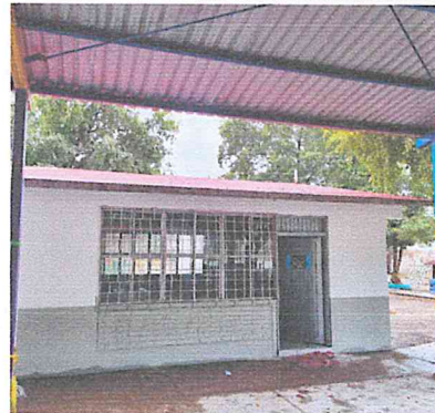
PUERTA DE LAMINA ESTRIADA DE PERFILES TUBULARES DE 1.00x2.35 MTS. INCL