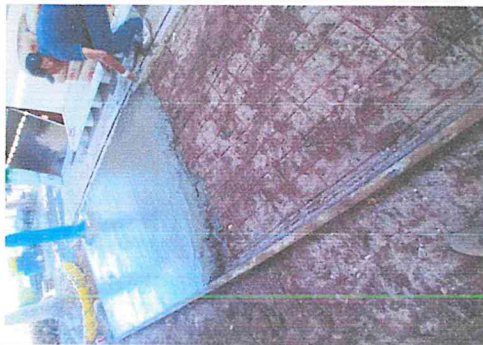
FIRME DE CONCRETO ARMADO CON MALLA-LAC 6-6/10-10 F'C=150 KG/CM2 DE 8