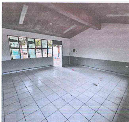
SUMINISTRO Y COLOCACION DE VITROPISO 33 x 33 CMS. INCLUYE: