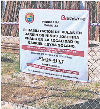
BANER ALUSIVO AL PROYECTO INCLUYE: LONA( BANER DE SECCION 1.00 X 1.00)