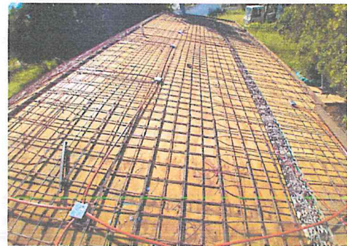
SUMINISTRO E INSTALACIÓN DE SALIDA ELECTRICA DE CENTRO , INCLUYE: