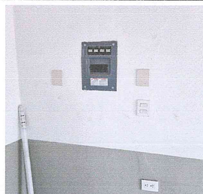
SUMINISTRO Y COLOCACIÓN DE TABLERO DE CONTROL (CENTRO DE CARGA)