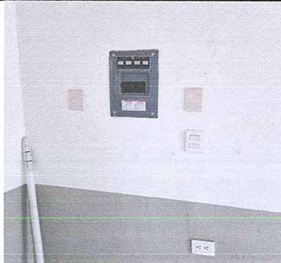
SUM. Y COL. DE INTERRUPTOR TERMOMAGNETICO DE 2 POLOS 15 A 50AMP. TIPO