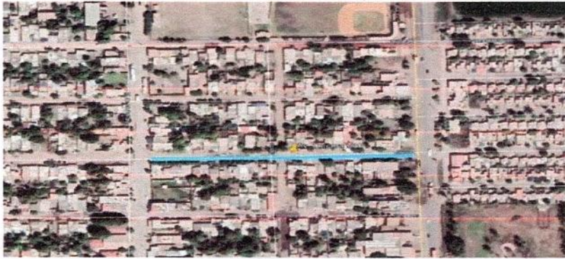
Localización de Google.