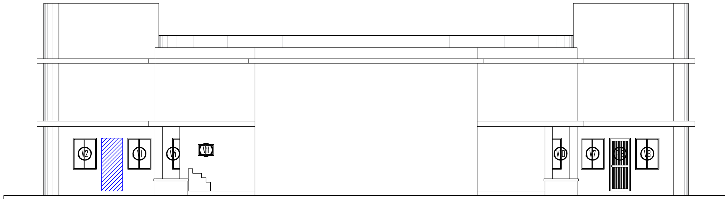
FACHADA POSTERIOR ACTUAL ESCALA 1:100