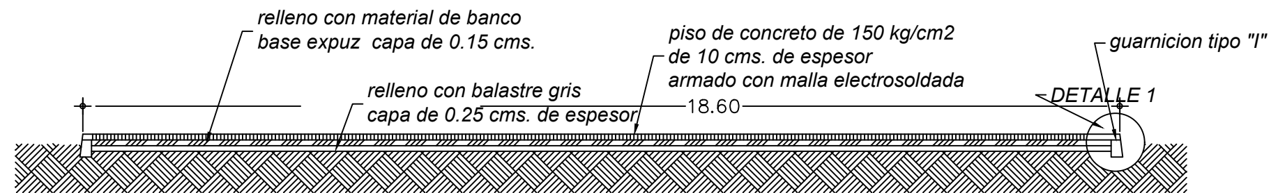
CORTE TRANSVERSAL PROYECTO DE PLAZA CIVICA